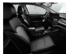
Tela L, LX (Versión sedán)