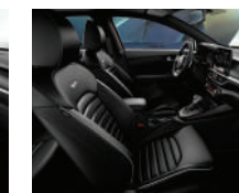
Synthetic leather GT Line (Versión sedán y hatchback)