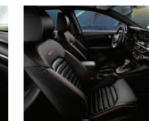
Synthetic leather GT (Versión sedán y hatchback)