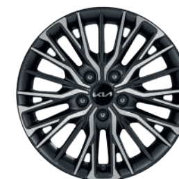
Rin 17" Versión GT Line/GT (Versión sedán y hatchback)