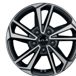
Rin 16" Versión LX, EX (Versión sedán y hatchback)