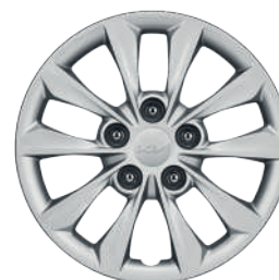
Tapón 16" Versión L (Versión sedán)