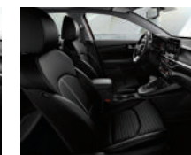
Tela EX (Versión hatchback)